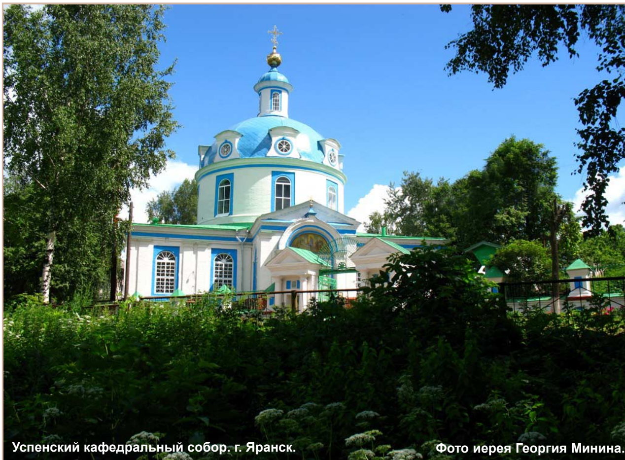
Успенский кафедральный собор. г. Ярославль.