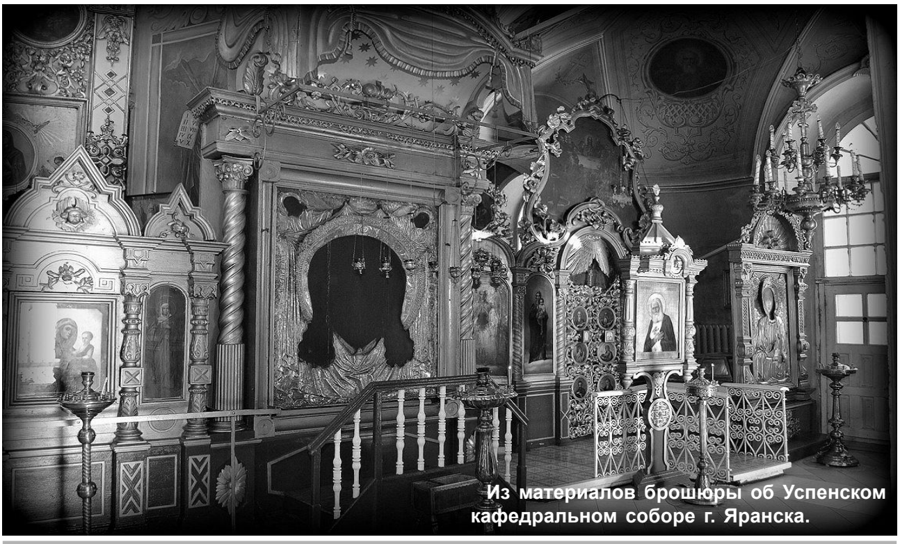
Из материалов брошюры об Успенском кафедральном соборе г. Яранска.

(в XV столетии), терпя стеснения от черемис, обратились за помощью к царю Иоанну Грозному. Занятый покорением Казани, царь Иоанн Грозный послал в Яранск образ Спасителя. «Когда жившие кругом Яранска черемиса нападали на достояние церковное, тогда от выноса этого образа Спасителя нападавшие получали слепоту и другие болезни; потом же при возсылании пред сим образом молитвы, с верою получали облегчение; а сверх того оный (образ) носится неоднократно в течение года вокруг Яранска, с благодарностию за избавление местных жителей в прошлые лета от скотского падежа, - был принимаем сей образ, как чудотворный, предками ихними и ими самими ежегодно в летнее время в селения для домовых и напольных молебнов с водоосвящением для испрашивания у Господа сил и благословения на дома и стоящие на корню хлеба».